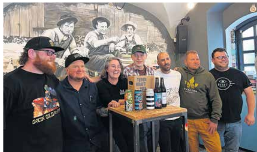
Kraft pivovarji so pivovarji z obrazom. To so pivovarne, pri katerih natančno veš, kdo stoji za pivom in kaj zagovarja. ✂ Teden kraft piva